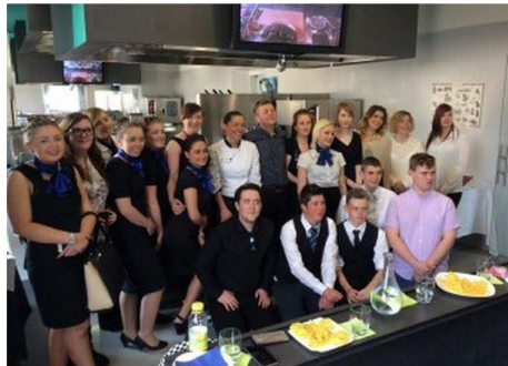
newcastle cooking school

GDOMENICONI 25 APRILE 2015 0 COMMENTI BENESSERE, CASA ARTUSI, PIADINA, QUALITÀ DELLA VITA. COOKING SCHOOL. STUDENTI NEWCASTLE. TRADIZIONE ROMAGNOLA. WELLNESS VALLEY