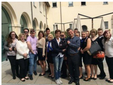
newcastle casa artusi

FORLIMPOPOLI. Gli studenti del Newcastle College in visita in Romagna per studiare Casa Artusi una delle eccellenze della Wellness Valley.